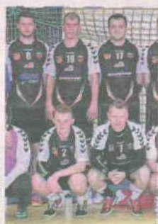
PIŁKA RĘCZNA TS ZEW ŚWIEBODZIN

Drugoligowa drużyna żeńskiej piłki ręcznej istnieje od 3 lat. Wyślij SMS o treści DRUZ.1 na numer 72355.