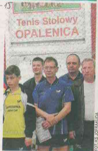
Nasi pingpongiści udanie zagrali w Wielkopolsce