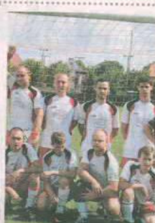
PIŁKA NOŻNA ODRA GLIŃSK

Drużyna prowadząca rozgrywki w B-klasie, w podokręgu Świebodzin. Wyślij SMS o treści DRUZ.15 na numer 72355.