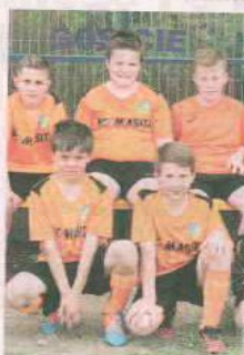
PIŁKA NOŻNA ZJEDNOCZENI LUBRZA

Trzecioligowa drużyna. Grupa dolnośląsko-lubuska. Wyślij SMS o treści DRUZ.21 na numer 72355.