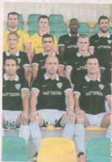
PIŁKA NOŻNA FORMACJA PORT 2000

Trzecioligowa drużyna. Grupa dolnośląsko-lubuska. Wyślij SMS o treści DRUZ.21 na numer 72355.