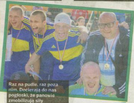
Raz na pudle, raz poza nim. Docierają do nas pogłoski, że panowie zmobilizują siły ostatniego dnia!