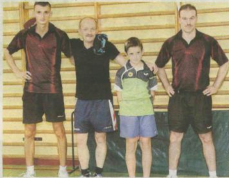
Jofrakuda Świebodzin istnieje i rywalizuje w ligach od 15 lat

Tenis stołowy nie jest tak popularną dyscypliną jak piłka nożna czy ręczna. Jak Wasz