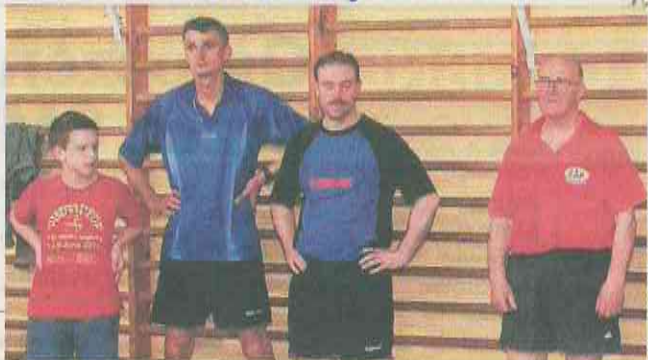
Jofrakuda Świebodzin przed meczem z ZKS-em Drzonków