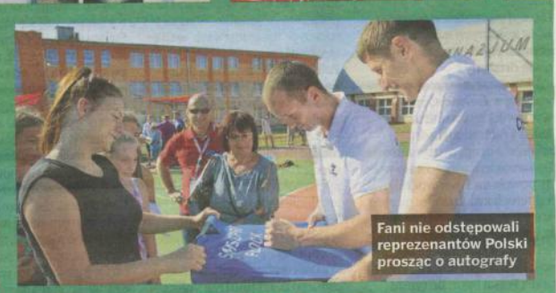
Fani nie odstępowali reprezentantów Polski prosząc o autografy