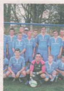
PIŁKA NOŻNA BIZON WILKOWO

Obecnie zespół gra w A-klasie podokręgu LZPN Świebodziń. Wyślij SMS o treści DRUZ.8 na numer 72355.