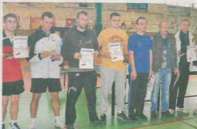
Wszyscy uczestnicy turnieju w Zbąszyniu otrzymali dyplomy, na najlepszych czekały pamiątkowe statuetki

Największym zainteresowaniem cieszyły się kategorie otwarte mężczyzn. W rozgrywkach obowiązywał system grupowy. Panowie zostali podzieleni na cztery grupy, z których dwóch najlepszych awansowa-