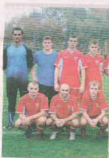
PIŁKA NOŻNA VICTORIA SZCZANIEC

Schnug Chociule gra w klasie A 2014/2015. Grupa Zielona Góra. Wyślij SMS o treści DRUZ.14 na numer 72355.