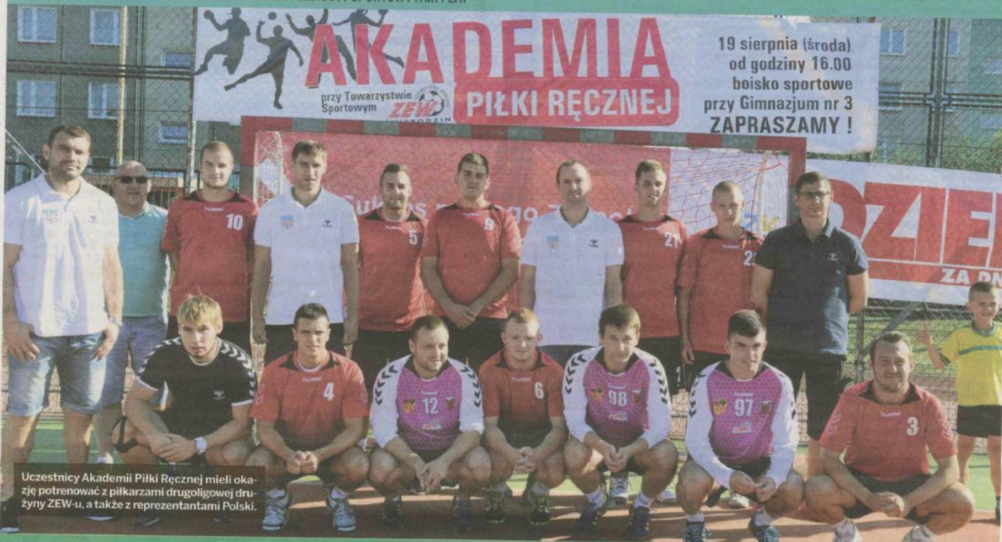
Uczestnicy Akademii Piłki Ręcznej mieli okazję potrenować z piłkarzami drugoligowej drużyny ZEW-u, a także z reprezentantami Polski.

UROCZYSTE OTWARCIE AKADEMII PIŁKI RĘCZNEJ PRZY TS ZEW ŚWIEBODZIN PODCZAS INAUGURACJI PODSUMOWALIŚMY NASZ PLEBISCYT SPORTOWY FAIR PLAY