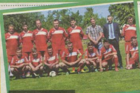
Delta Smardzewo, obecnie zajmuje 1 miejsce w naszym plebiscycie. Czy ktoś im zagrozi?

Każdy wysłany SMS to dodatkowych 10 punktów na konto Waszego faworyta. Głosujemy do 17 lipca! 1 lipca zamknęliśmy głosowanie na stronie internetowej swiebodzin.naszemiasto.pl, a 17 lipca oznacza ostatni dzień I edycji plebiscytu Fair Play na najpopularniejszego sportowca i drużyny sportową! Nie liczcie, że SMS wysłał za Was inni, zgłoszcie już dziś i pomóżcie Waszym faworytom wygrać plebiscytowe mistrzostwa indywidualne i grupowe!