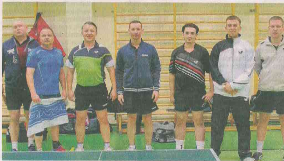
Wspólne zdjęcie pomeczowe Jofrakudy II Świebodzin i Jedności Podmokle