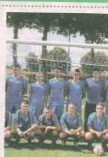
PIŁKA NOŻNA SCHNUG CHOCIULE

Świebodziński klub istniejący od 2009 roku. 2014/2015 IV liga. Wyślij SMS o treści DRUZ.6 na numer 72355.