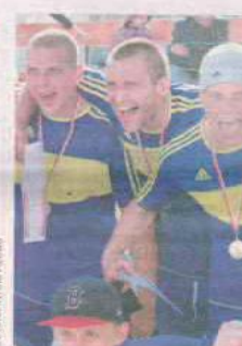
PIŁKA ULICZNA NOWY DWOREK

Klub tenisa stołowego Jofrakuda istnieje w Świebodziń od 15 lat. Wyślij SMS o treści DRUZ.18na numer 72355.