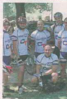
MTM COMPUTEC TEAM ŚWIEBODZIN

Ruszyło nasze plebiscytowe głosowanie! Kliknięcie na stronie internetowej daje Waszemu faworytowi 1 punkt, a każdy wysłany SMS to 10 punktów! Koszt wysłanego SMS to 2,46 zł + vat. Wyślij SMS na numer 72355!