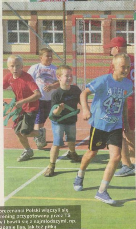
Reprezentanci Polski włączyli się w trening przygotowany przez TS Zew i bawili się z najmłodszymi, np. w łapanie lisa, jak też piłką