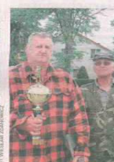
DRUŻYNA WĘDKARSKA GWAREK SIENIAWA

Grupa wędkarzy z Mostek i okolic, która utworzyła własne stowarzyszenie. Wyślij SMS o treści DRUZ.24 na numer 72355.