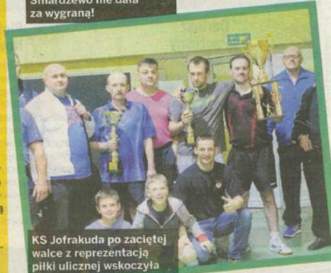
KS Jofrakuda po zwycięstwie walczy z reprezentacją piłki ulicznej wskoczyła na podium.