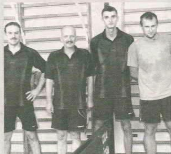
Wspólne zdjęcie pierwszego zespołu Jofrakudy.