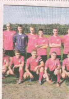
PIŁKA NOŻNA LUBUSZE RUSINÓW

Zjednoczeni Lubrza, drużyny seniorów i juniorów. Wyślij SMS o treści DRUZ.13 na numer 72355.