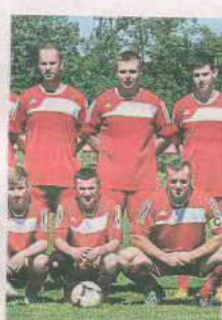
PIŁKA NOŻNA DELTA SMARDZEWO

Klub obecnie zrzesza około 40 zawodników w drużynie seniorskiej i juniorskiej. Wyślij SMS o treści DRUZ.5 na numer 72355.