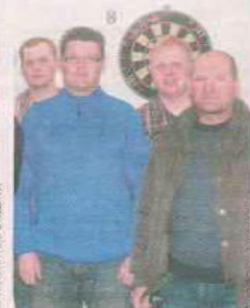
DART TEAM SKARPA ŚWIEBODZIN

Drużyna CompuTec od wielu lat odnosi sukcesy w rajdach MTB. Wyślij SMS o treści DRUZ.17 na numer 72355.