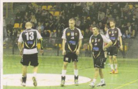
TS ZEW Świebodzin wygrał rywalizację zespołową