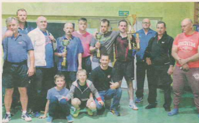
Z takimi okazałymi pucharami każdy chciał zrobić sobie zdjęcie, nie tylko zwycięzcy...