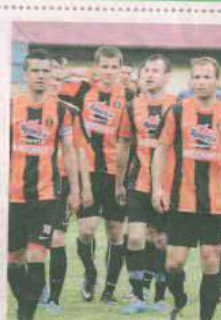
PIŁKA NOŻNA SANTOS ŚWIEBODZIN

Drużyna prowadząca rozgrywki w B-klasie, podokręg Świebodzin. Wyślij SMS o treści DRUZ.12 na numer 72355.