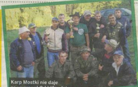
Karp Mostki nie daje za wygraną! Od kilku dni utrzymuje się w pierwszej dziesiątce. Wędkarze liczą na Wasze głosy!

Każdy wysłany SMS to dodatkowych 10 punktów na konto Waszego faworyta. Głosujemy do 17 lipca! 1 lipca zamknęliśmy głosowanie na stronie internetowej swiebodzin.naszemiasto.pl, a 17 lipca oznacza ostatni dzień 1 edycji plebiscytu Fair Play na najpopularniejszego sportowca i drużynę sportową! Nie liczcie, że SMS wysłał za Was inni, zagłosujcie już dziś i pomóżcie Waszym faworytom wygrać plebiscytowe mistrzostwa indywidualne i grupowe!