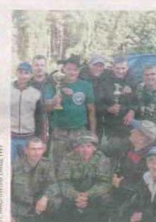
DRUŻYNA WĘDKARSKA KARP MOSTKI

Drużyna Ośrodka Nowy Dworek to aktualny mistrz Polski w piłce ulicznej. Wyślij SMS o treści DRUZ.22 na numer 72355.