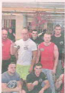
ARM STRONG ŚWIEBODZIN

Drużyna grająca w ramach Zielonogórskiej Ligi Steel Darta. Wyślij SMS o treści DRUZ.16 na numer 72355.