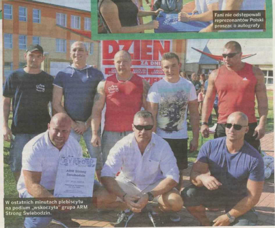
W ostatnich minutach plebiscytu na podium „wskoczyła” grupa ARM Strong Świebodzin.