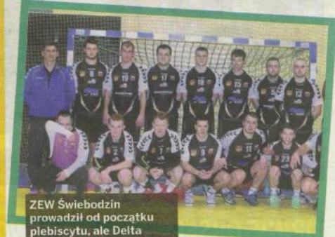
ZEW Świebodzin prowadził od początku plebiscytu, ale Delta Smardzewo nie dała za wygraną!