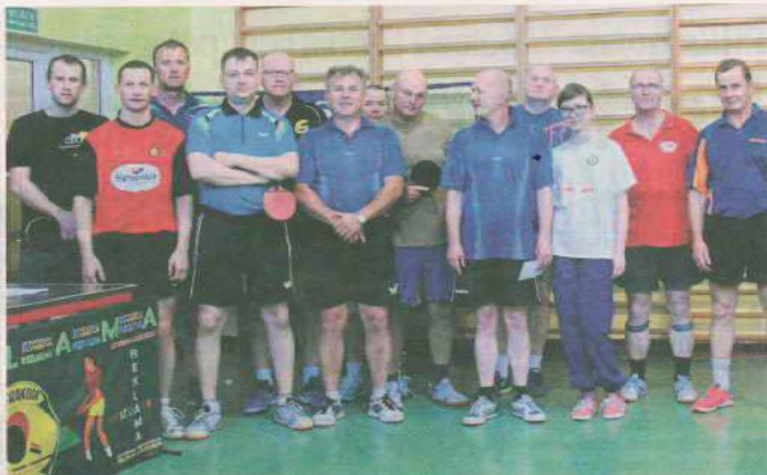
Zawodnicy świebodzińskiej Jofrakudy przed jubileuszowymi zawodami w klubie