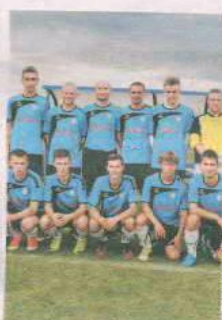
PIŁKA NOŻNA ZRYW RZECZYCA

Drużyna prowadząca rozgrywki w B-klasie, podokręg Świebodzin. Wyślij SMS o treści DRUZ.19 na numer 72355.