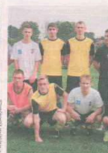
PIŁKA NOŻNA BŁĘKITNI OŁOBOK

Klasa A grupa I Zielonej Góry oraz Młodzik, podokręg Świebodziń. Wyślij SMS o treści DRUZ.7 na numer 72355.