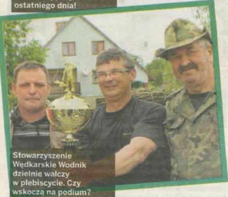
Stowarzyszenie Wędkarskie Wodnik dzielnie walczy w plebiscycie. Czy wskoczą na podium?