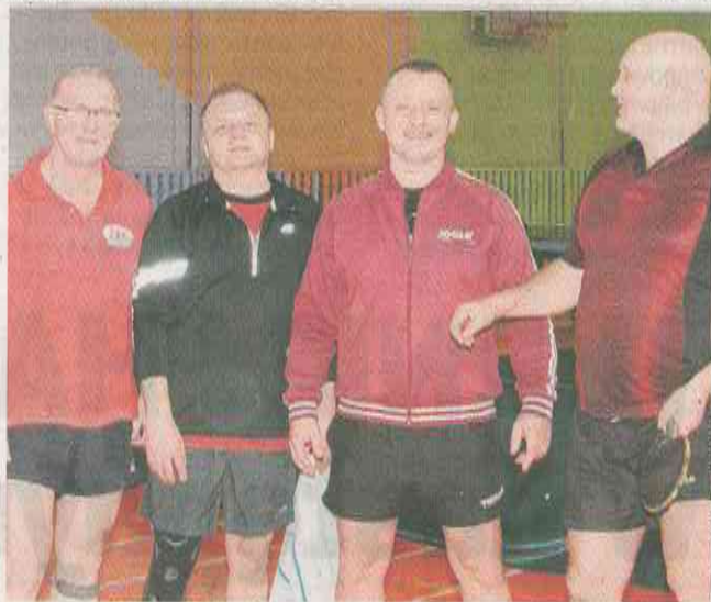
Zespół Jofrakudy II Świebodzin