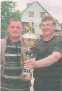
DRUŻYNA WĘDKARSKA WODNIK ŁĄGÓWEK

Koło wędkarskie powstało w 1955. Zrzesza ponad 70 osób. Wyślij SMS o treści DRUZ.9 na numer 72355.