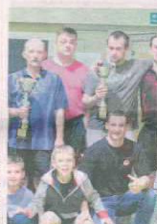
KS JOFRAKUDA ŚWIEBODZIN

W klubie prowadzone są szkolenia w zakresie boxu, kickboxingu, muay - thai. Wyślij SMS o treści DRUZ.2 na numer 72355.