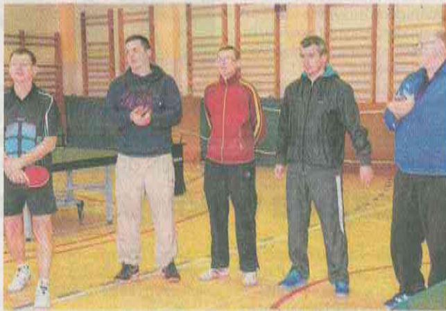
Drużyna Ganesy Radoszyn zagrała z Top Spinem Kargowa rewelacyjnie i zasłużyła na oklaski kibiców pingponga

Interesująco zapowiadał się pojedynek Ganesy Radoszyn z Top Spinem Kargowa. Przyjezdni od lat należą do grona trudnych przeciwników. Nieoczekiwanie zatem wygrali go-