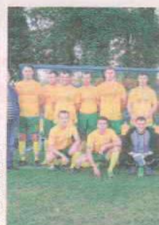
PIŁKA NOŻNA AVIA WĘGRZYCNICE

Towarzystwo Sportowe ZEW Świebodziń. Drużyny Senior, Junior, Młodzik. Wyślij SMS o treści DRUZ.3 na numer 72355.