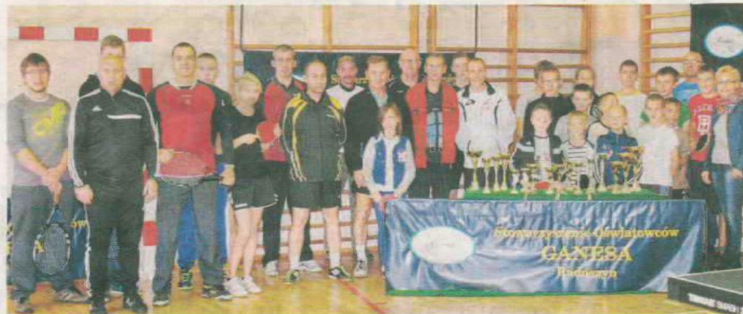
Uczestnicy obu turniejów tenisowych w Radoszynie na wspólnej fotografii przed wręczeniem pucharów zwycięzcom.

Liczna grupa tenisistów stołowych została podzielona na cztery kategorie: szkoły podstawowe-roczniki 2002-2006 (7 osób), młodzik-roczniki 2001-1997 (8 osób), seniorzy (3 osoby), weterani (6 osób). Wszyscy uczestnicy ostro ze