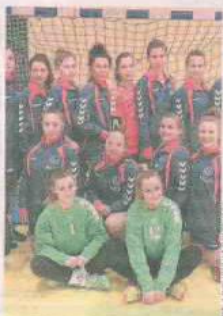
PIŁKA RĘCZNA MUKS LIDER ŚWIEBODZIN

Koło Wędkarskie z Łągówka istnieje od 5 lat, zrzesza około 30 członków. Wyślij SMS o treści DRUZ.10 na numer 72355.